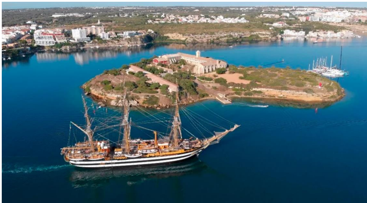
Nave Vespucci presso Mahòn in visita al Mausoleo di 26 marò della corazzata "Roma"