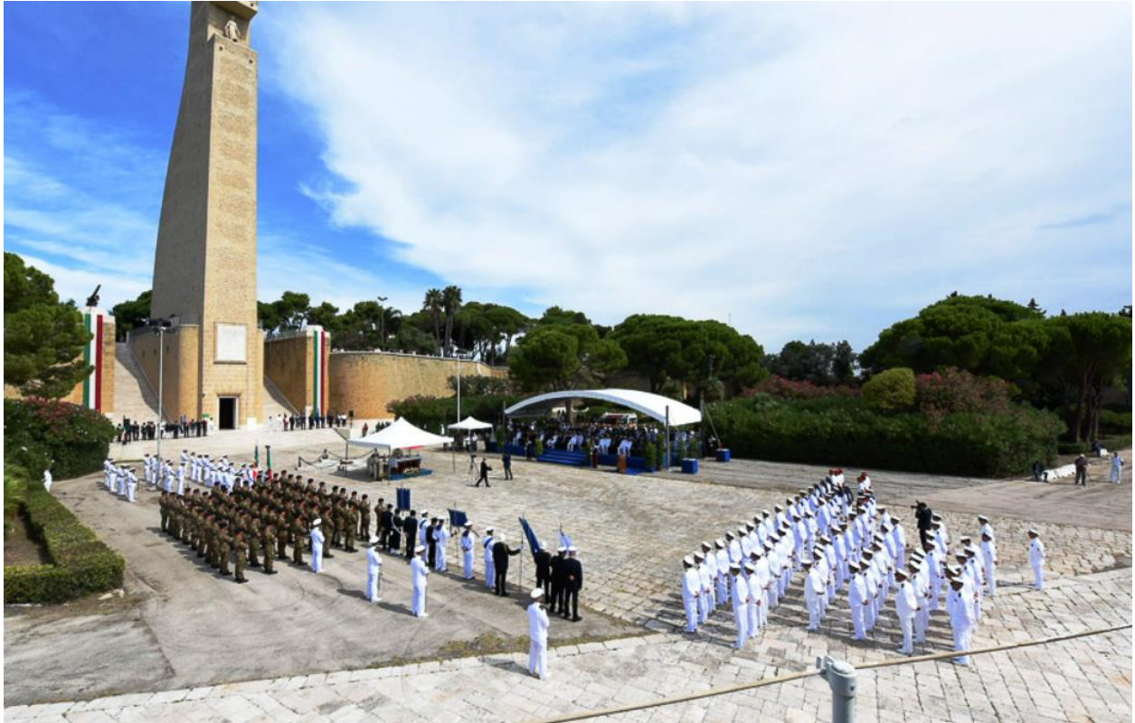
Cerimonia del 9 settembre al Monumento al Marinaio d'Italia