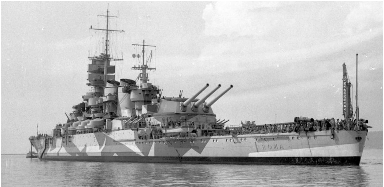
La nave Corazzata "Roma"