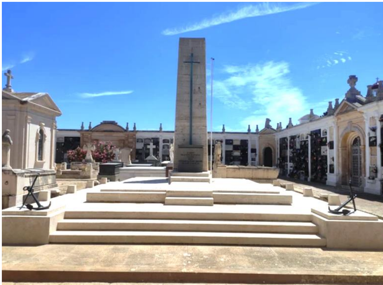
Mausoleo di Mahòn nelle Baleari - tomba di 26 marò della corazzata "Roma"