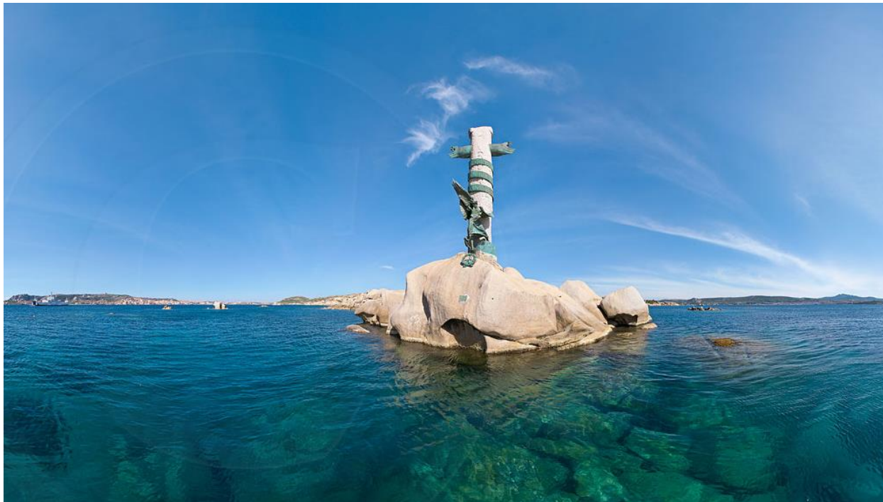
Scoglio Roma con il monumento ai caduti della corazzata “Roma”

L'elenco Bergamini | www.regianaveroma.org